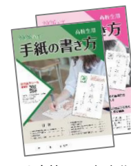
●高校1・2・3年生共通